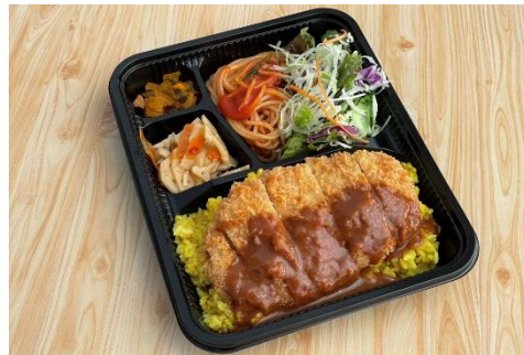
AC-02 トルコライス弁当