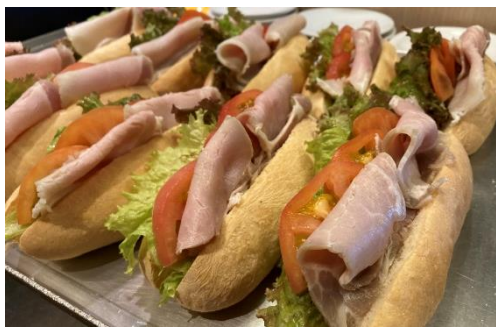
AC-01 野菜たっぷりサンドイッチBOX

長崎港を一望出来る商業施設「長崎出島ワーフ」の1Fにあるカフェレストラン。 長崎名物の“トルコライス”や龍馬カプチーノ、本格ナポリピッツァなどあります。