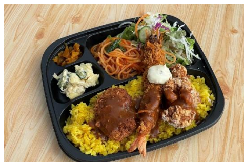
AC-04 特製トルコライス弁当

エビフライ、ヒレカツなどが乗ったボリューム満点のトルコライス。 1,500円 (税込)