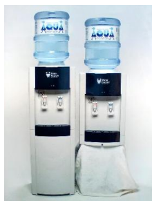
床置きタイプ(写真左) 幅34cm・奥35cm・高さ101cm