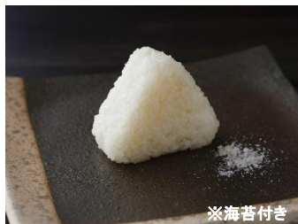
CB-03 塩おにぎり 10個

お米の販売を中心に食品全般の卸売を通じて食の安全と美味しさを届けております。長崎の美味しい具材を「おにぎり」通して、広げていきたい思いをもって、長崎のお米、五島列島のお塩、長崎の具材などを使用したご当地メニューを中心にお届けいたします。