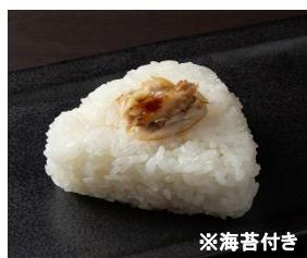
CB-06 焼きサバ 10個