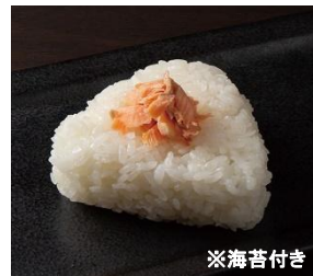
CB-05 鮭おにぎり 10個