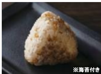
CB-04 雑穀米もち麦 10個

希少な国産紫もち麦「ダイシモチ」を使用。もち麦は食物繊維豊富でモチモチとしたうるち米とは違う食感をお楽しみ頂けます。