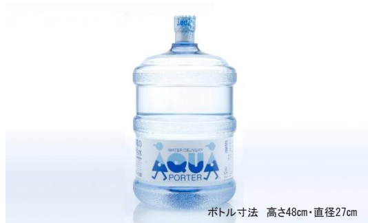
ボトル寸法 高さ48cm・直径27cm

アクアポーターは、長崎の自然が育んだ良質なミネラルウォーターを製造・提供しています。製造から配送まで自社で一貫管理し、安心の品質をお届けしています。