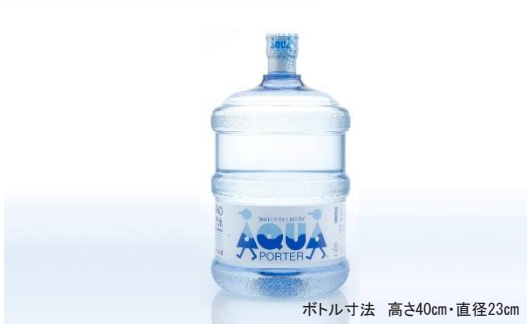
ボトル寸法 高さ40cm・直径23cm