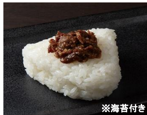
CB-07 牛しぐれ 10個