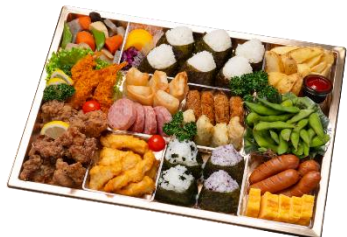
D ピクニックオードブル