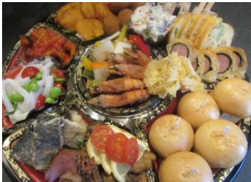
※写真は5名様分の盛り合わせです。