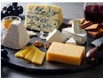
※写真は20名様分となっております。