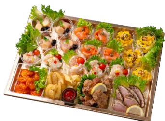
A カップデリアソート