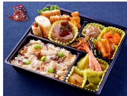
KS-02 長崎和華蘭弁当 鼓(つづみ)

長崎産のアジフライ・ハトシを入れて長崎を演出しました。 ご飯は炊き込みご飯です。