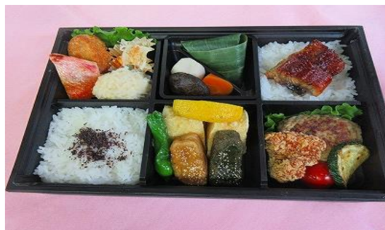
UH-03 梅の花ハンバーグ弁当