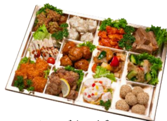
C チャイニーズオードブル