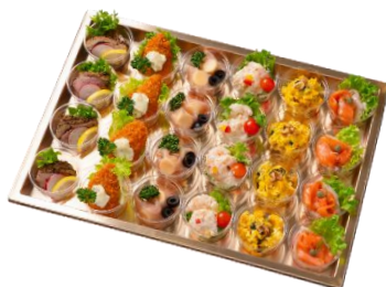
B カップインオードブル