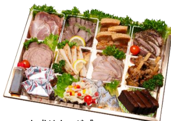
E 肉盛りオードブル