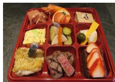
※和風メニューも対応できます。