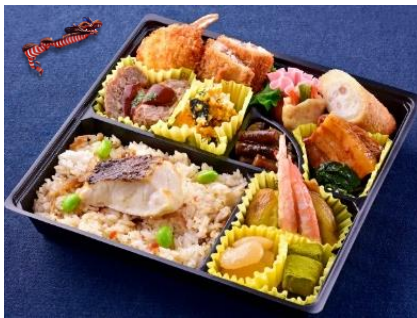
KS-01 長崎和華蘭弁当 龍(りゅう)

長崎の美味しいものを食べて欲しい！和華蘭文化にちなんだ食材でお弁当を作りお届けします。