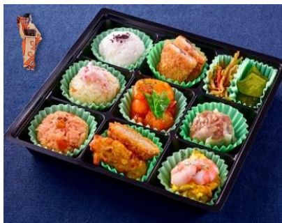
KS-03 長崎和華蘭弁当 踊(おどり)

大粒の焼売を贅沢に使い、長崎産のアジフライを使いました。 彩り豊かなお弁当です。