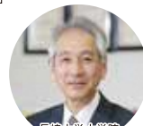
長崎大学大学院 医歯薬学総合研究科教授 前田隆浩氏